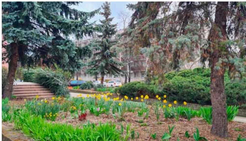
Wiosna na osiedlu

Rząd i sejm to orzeczenie zignorował. Nowa ustawa – z identycznym brzmieniem – weszła w życie 30.12.2009 r. (sic!). Bo u nas obowiązuje (zawsze powtarzam) domniemanie zgodności z Konstytucją, dopóki nie wyda innego orzeczenia Trybunał Konstytucyjny.