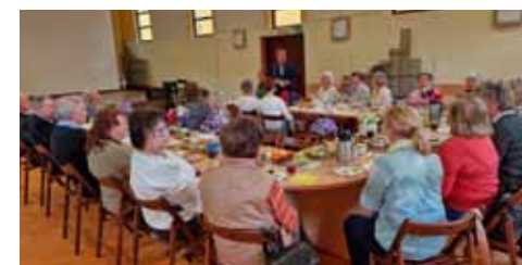
Spotkanie wielkanocne Seniorów z Zarządem