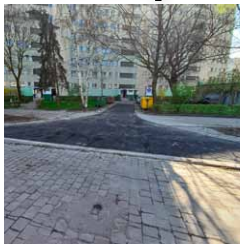
Nowy podjazd na ul. Lubuskiej 70-76