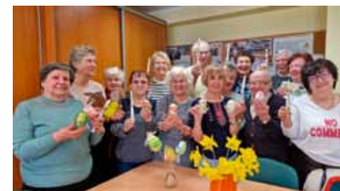
Warsztaty rękodziela w Klubie Seniora