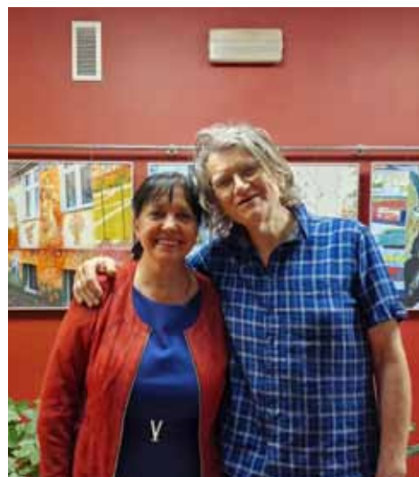
Finisaż wystawy fundacji OK.ART