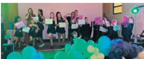
Zakończenie sezonu PW Dance (certyfikaty, prezentacje)

Piknik osiedlowy na początku czerwca był swoistym preludium wydarzeń zbliżających nas do wakacji.