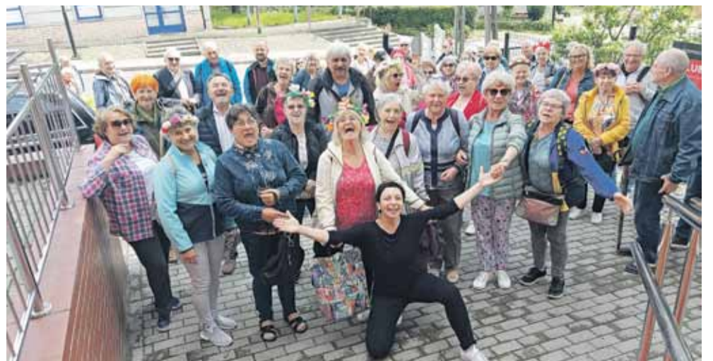
Wycieczka seniorów do Jedliny Zdrój na powitanie lata