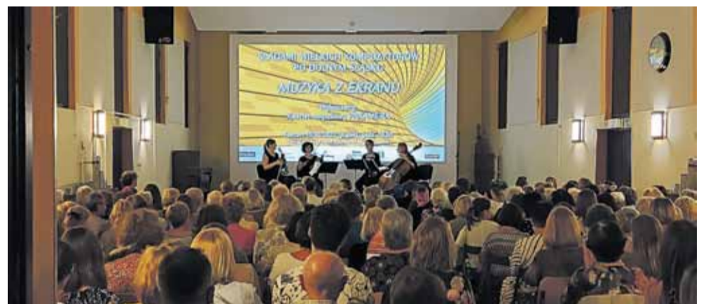
Koncert kwartetu Pakamera