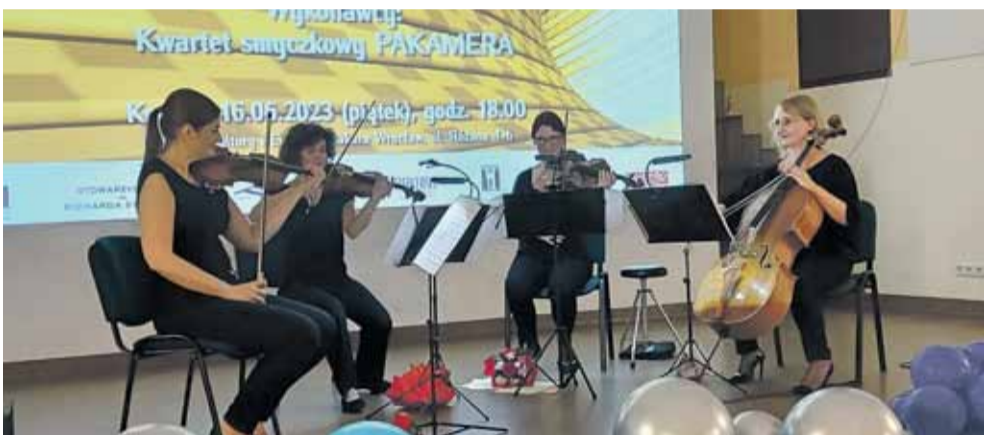
Koncert kwartetu Pakamera