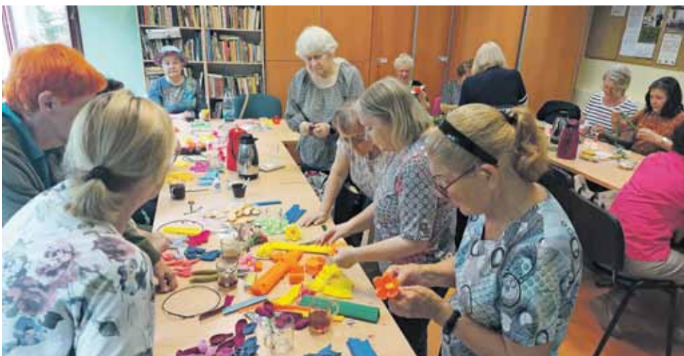
Wianki na powitanie lata - warsztaty w Klubie Seniora 14.06.