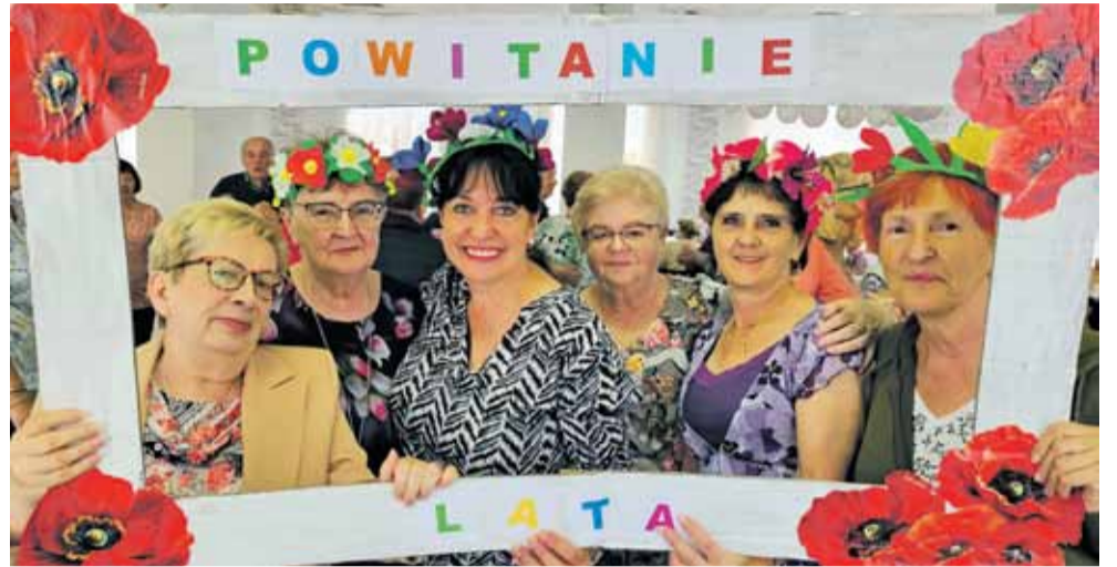
Wycieczka seniorów do Jedliny Zdrój na powitanie lata