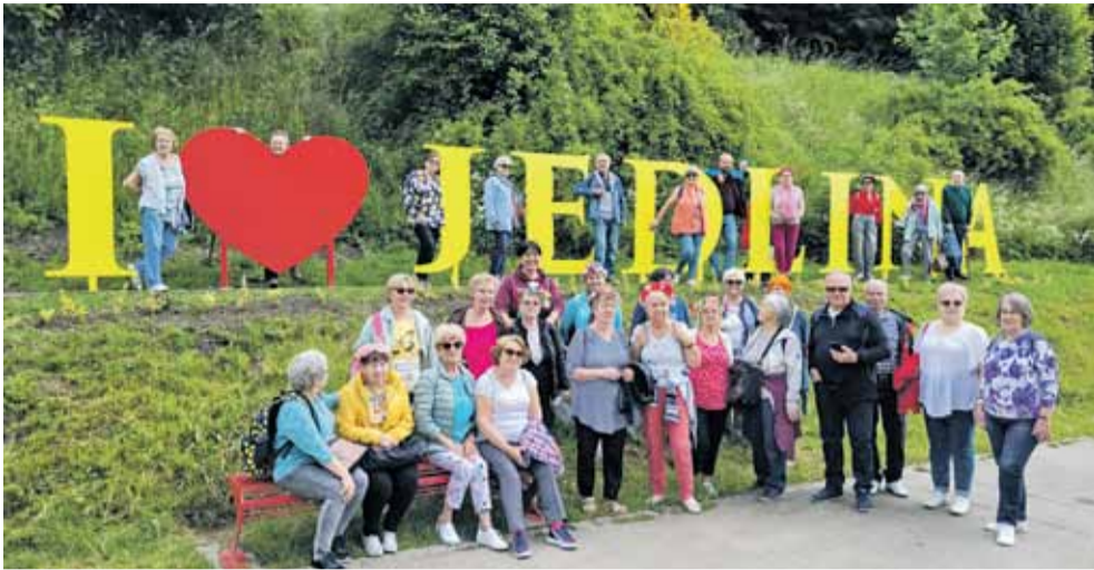
Wycieczka seniorów do Jedliny Zdrój na powitanie lata