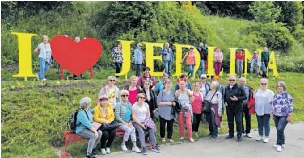
Wycieczka seniorów do Jedliny Zdrój na powitanie lata