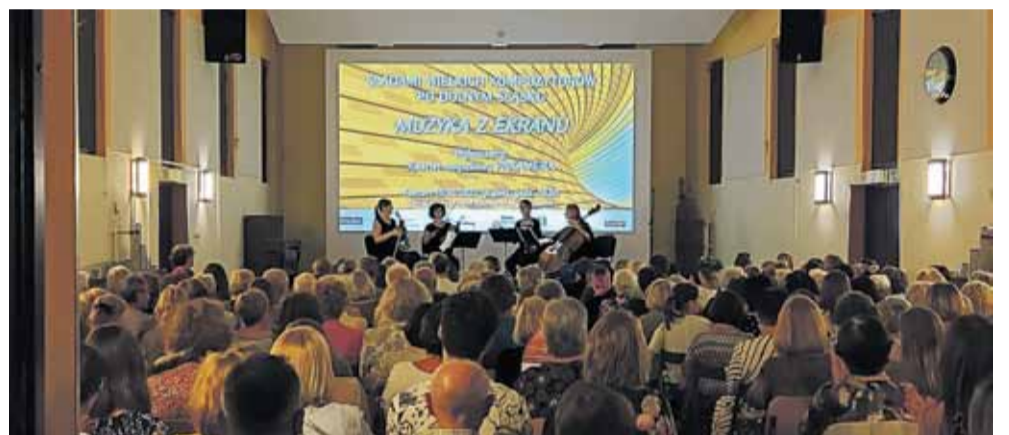
Koncert kwartetu Pakamera