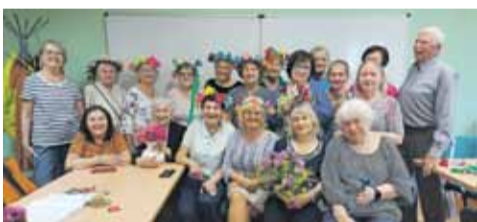
Wianki na powitanie lata - warsztaty w Klubie Seniora 14.06.

15 czerwca Klub Seniora Bakara wraz z Klubem Magnolia z Nowego Dworu na zaproszenie burmistrza i tamtejszego środowiska senioralnego wzięły udział we wspólnym wycieczce do Jedliny Zdroju. Zorganizowane tam uroczyste powitanie lata połączone było ze zwiedzaniem, prezentacjami, początkiem i zabawą taneczną. Nasi Seniorzy zostali przyjęci „po królewsku”, wracali autobusem, jak to dawniej bywało, pełni wrażeń, ze śmiechem i uśmiechem na ustach. Następnego dnia przed południem w Bakarze odbyła się „studniówka” zaprzyjaźnionego z Bakarą przedszkola. Całość wypadła niezwykle elegancko, jak na taką uroczystość przystało.