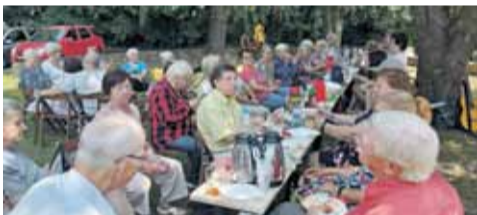
Grill seniorów 21.06 - biesiada przed Bakarą