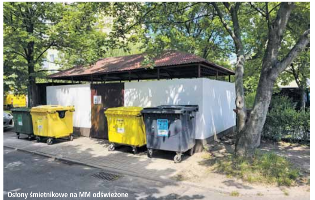
Oslony śmietnikowe na MM odświeżone